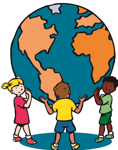
De Vreedzame School

In de school hangen verschillende prikborden waarop u kunt terug zien waar we aan werken.